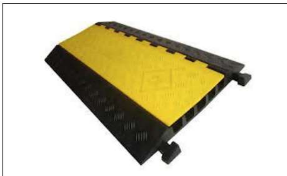
Figura 01: Imagem de referência