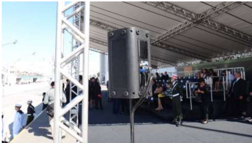
Imagem referencial das caixas na Tenda Palanque