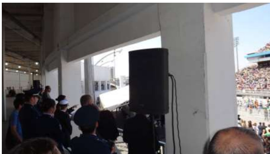
Imagem referencial das caixas no mezanino