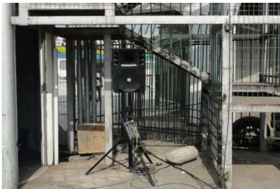
Imagem referencial da sonorização na Área de Imprensa