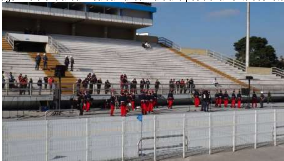
Imagem referencial da Área da Banda Marcial e posicionamento dos retornos