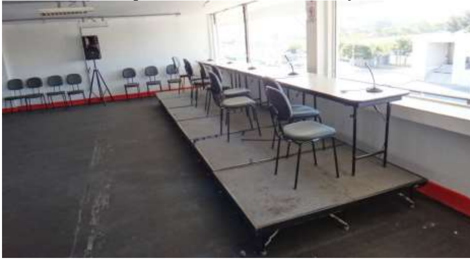
Imagem referencial da Sala de Locução