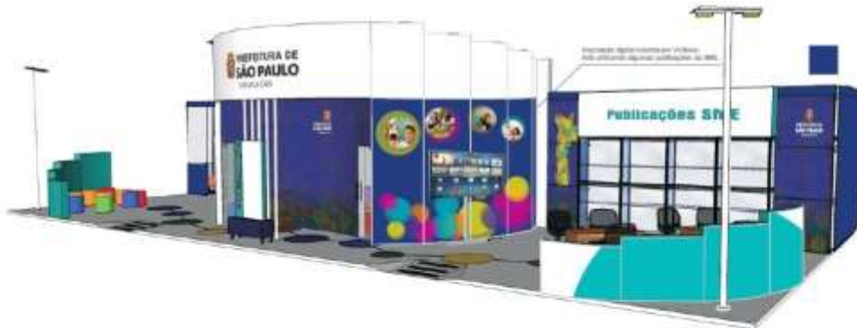
Local: Nove de Julho e Aze | CM | 09/01/2019